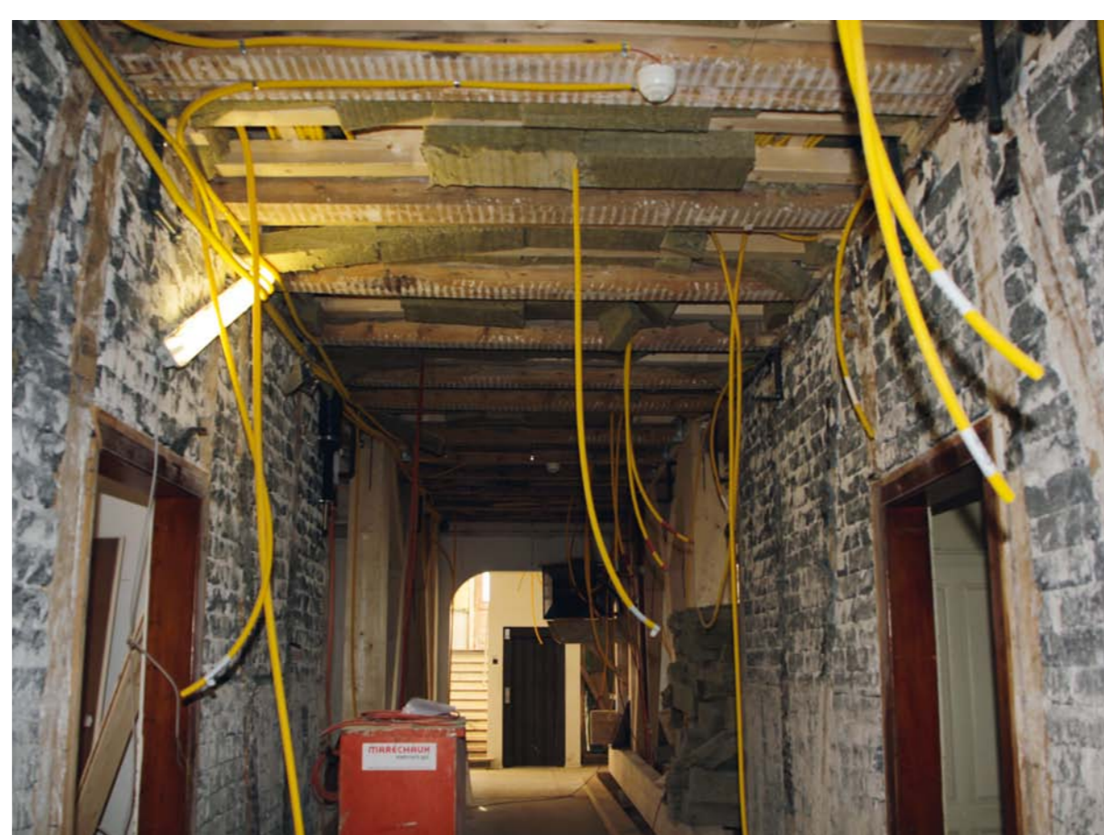
Korridor im Rohbau