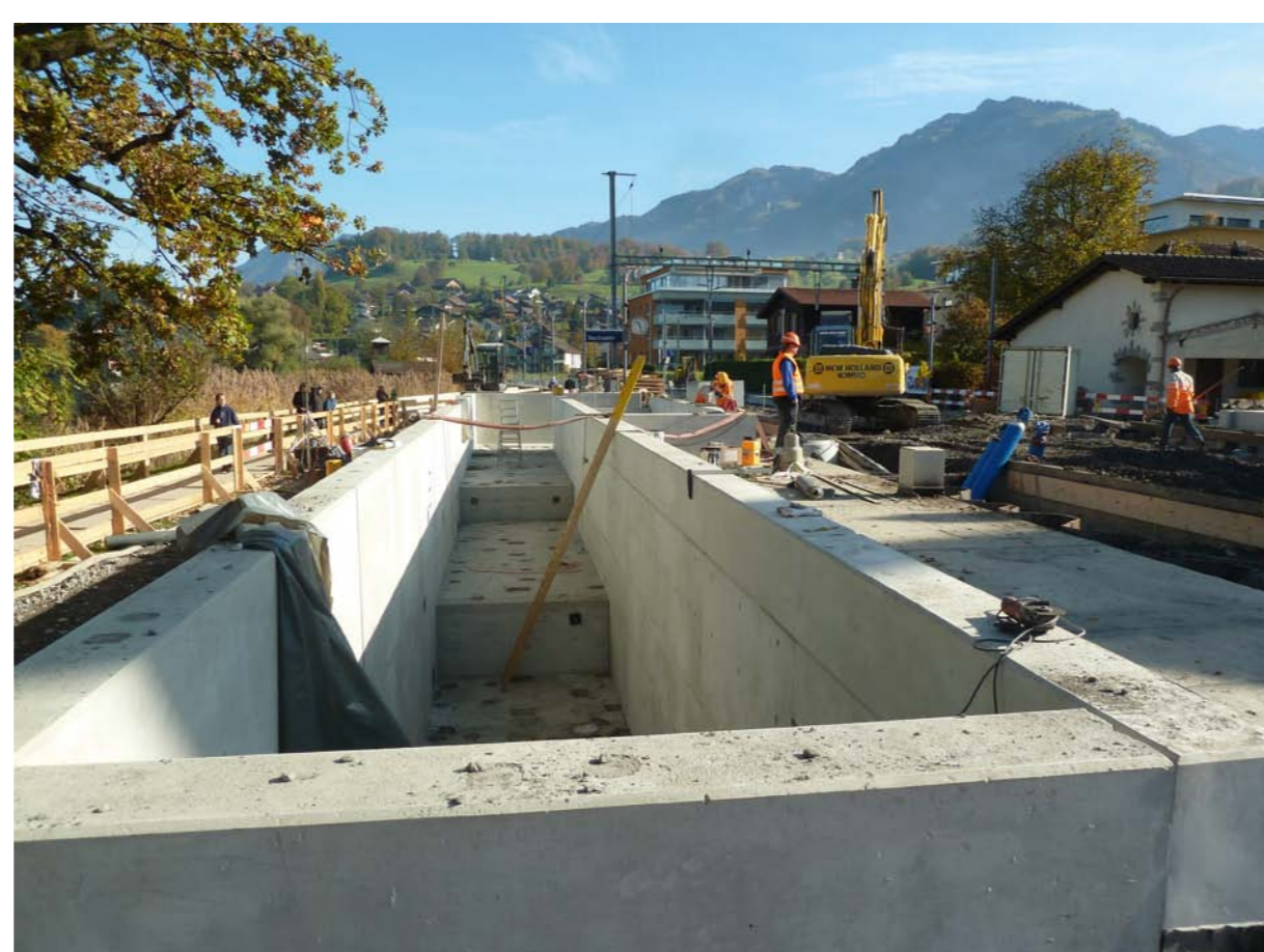
Unterführung im Rohbau